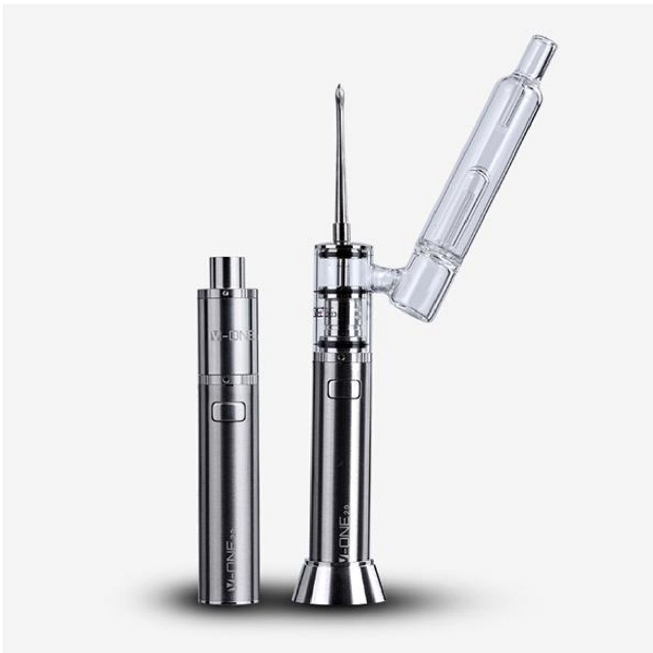
XVAPE V-ONE 2.0 Vaporizer