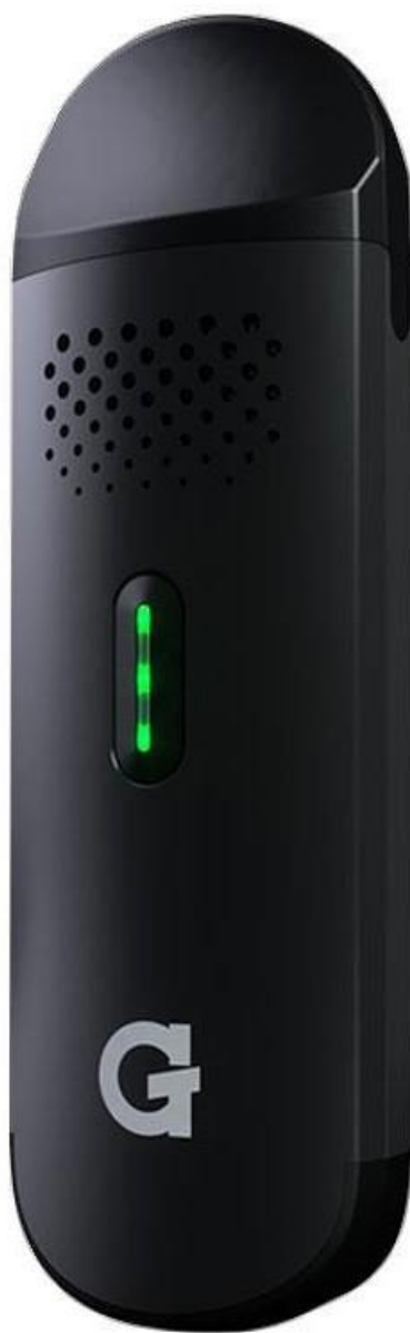
G Pen Dash