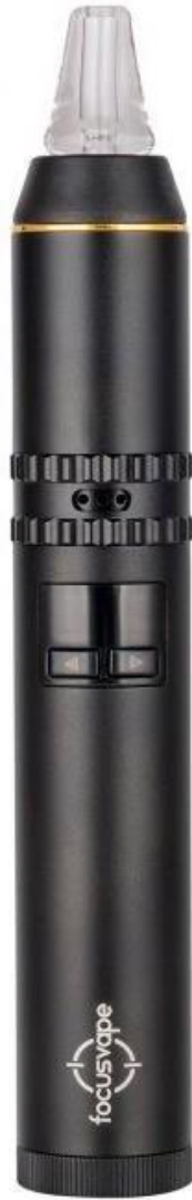
Focusvape Pro S Vaporizer black