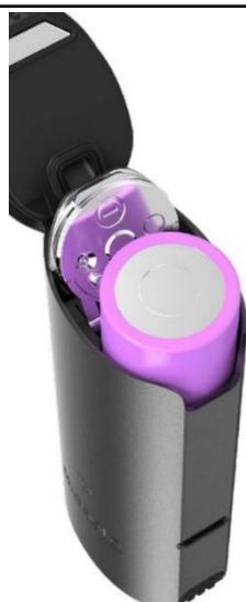
Вид вапорайзера MIQRO C зі знімним акумулятором 18350

Літійово-іонний акумулятор 18350 з плоскою головкою можна витягти з пристрою.