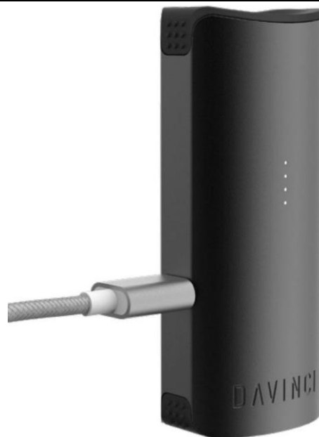
Вид вапорайзера MIQRO C із приєднаним до нього кабелем для заряджання USB тип C