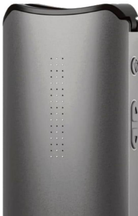
Вид вапорайзера IQS у режимі прискорення

Вапорайзери DAVINCI нагріваються з точністю до одного градуса, що дає змогу користувачам випаровувати активні речовини саме на тій температурі, на якій вони виділяються.