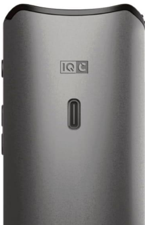
Вид на порт USB-C