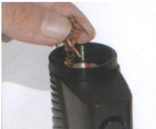
Легкое наполнение камеры