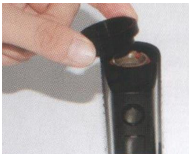
Снятие крышки камеры