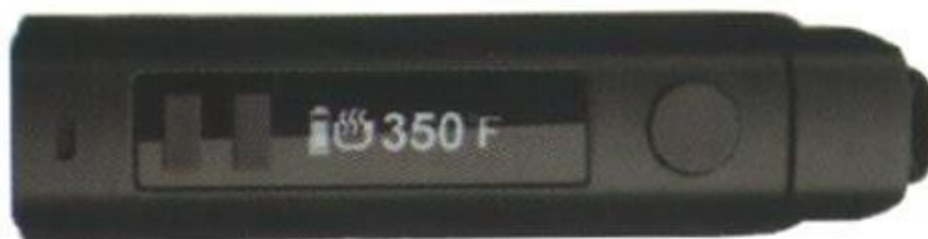
«+» «-» Кнопка управления питанием

Режим дисплея: 0,86 дюймовый дисплей на органических светодиодах с функцией смены ориентации.