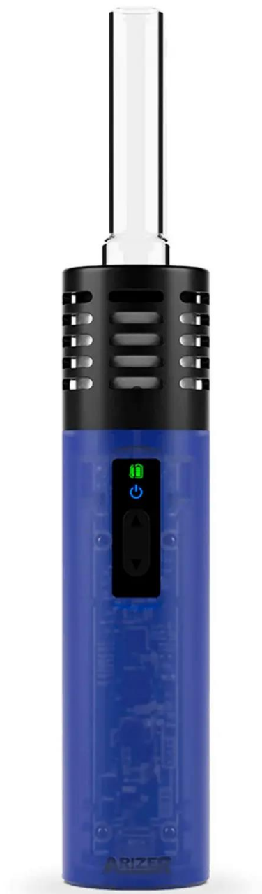
Arizer Air SE