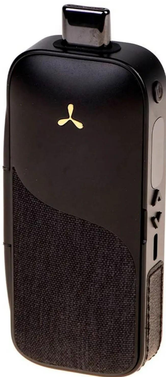
AirVape Legacy Pro